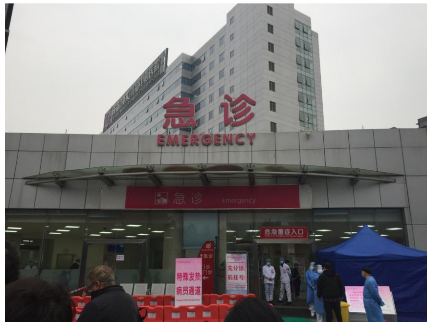
Многопрофильный «назначенный» госпиталь с зоной изоляции